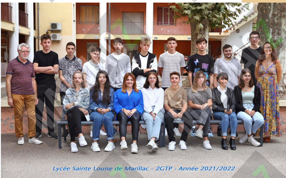
Lycée Sainte Louise de Marillac - 2GTP - Année 2021/2022

Les points positifs et négatifs : Les positifs étaient l'ambiance de la classe, les personnes que j'ai rencontrées et les bons professeurs. Le point négatif est le peu de sorties que l'on a faites.