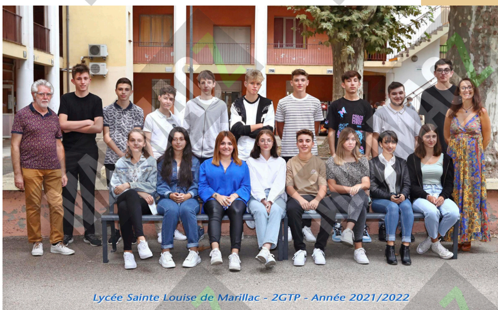
Lycée Sainte Louise de Marillac - 2GTP - Année 2021/2022

Il y a une partie qui reste en général parce qu'ils ont le "niveau" et/ou que leur "seule" option d'orientation est de partir en général ou technologique, et d'autres partent en professionnel, car c'est leur seule option pour réussir leur projet d'orientation et de poursuite d'études et pour beaucoup un choix.